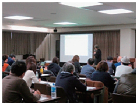
令和 6 年 2 月 4 日(日) 広島会場

※受講対象者には、10 月初め頃に開催案内、申込書を送付する予定です。 開催日の 15 日前まで申込みができます。